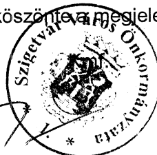
Konkoly Gergő jegyzőkönyv-hitelesítő