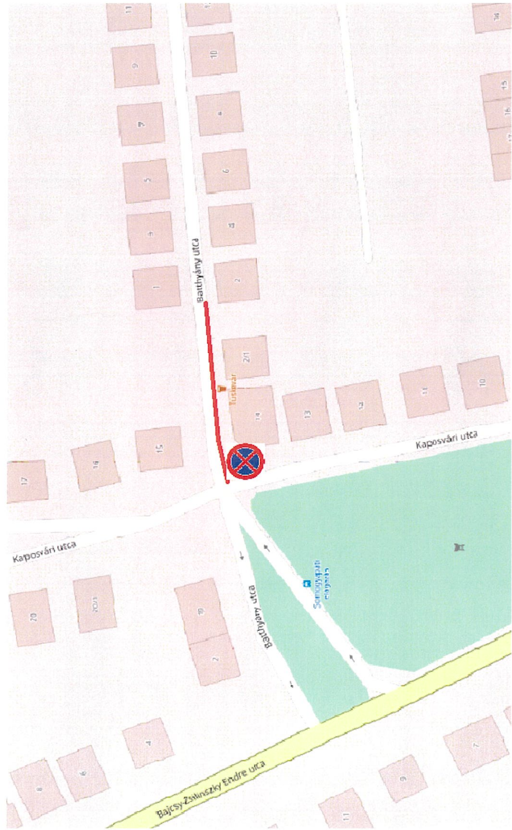
A Batthyány utca és Kaposvári utca kereszteződésében a kórház felé vezető, menetirány szerinti jobb oldalon megállni tilos tábla került kihelyezésre, ami 40-m-en keresztül hatályos. (Tuskevár presszótól a Batthyány utca 2.-es számig.)